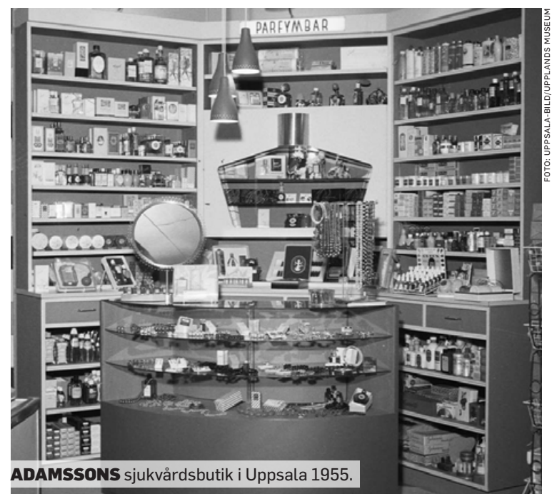
ADAMSSONS sjukvårdsbutik i Uppsala 1955.