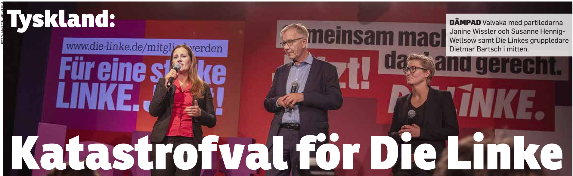
DÄMPAD Valvaka med partiledarna Janine Wissler och Susanne Hennig-Wellsow samt Die Linkes gruppleddare Dietmar Bartsch i mitten.