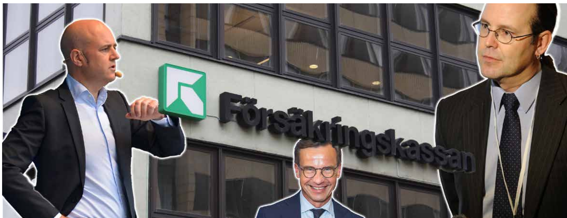
DEB MONTAGE!