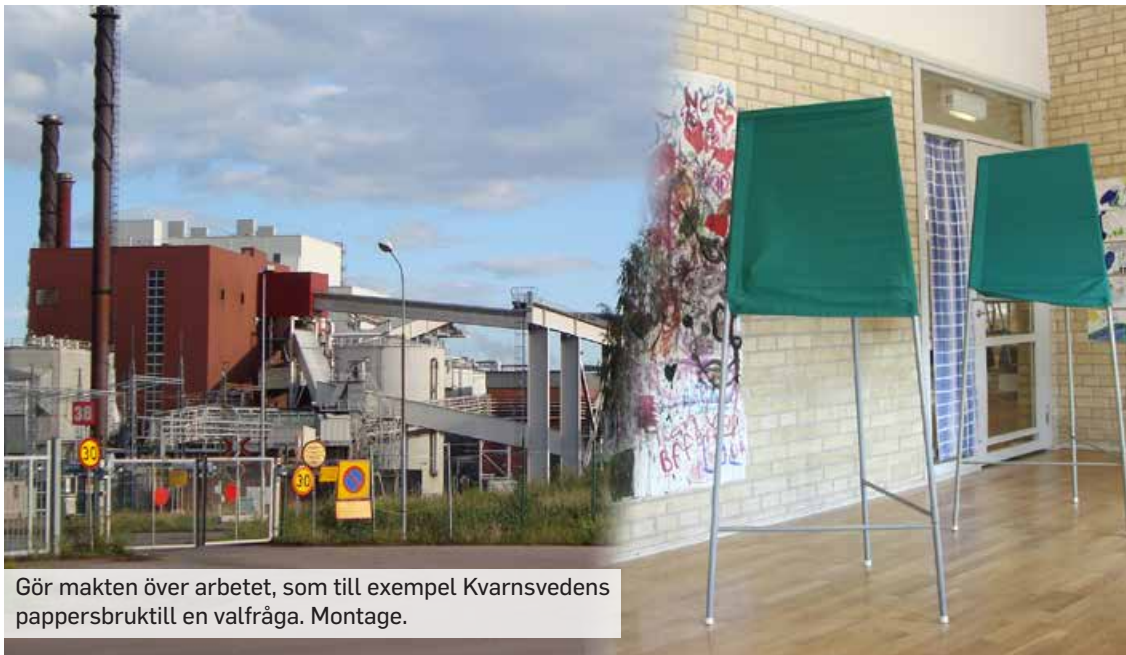
Gör makten över arbetet, som till exempel Kvarnsvedens pappersbruk till en valfråga. Montage.

En central uppgift i valet 2022 är driva frågan om de anställdas makt över sitt arbete och att stödja fackligt aktivas kamp för avtal som ger reell beslutanderätt till de fackliga organisationerna. Den offentliga sektorn kan här gå före och genom beslut och avtal överföra makten över