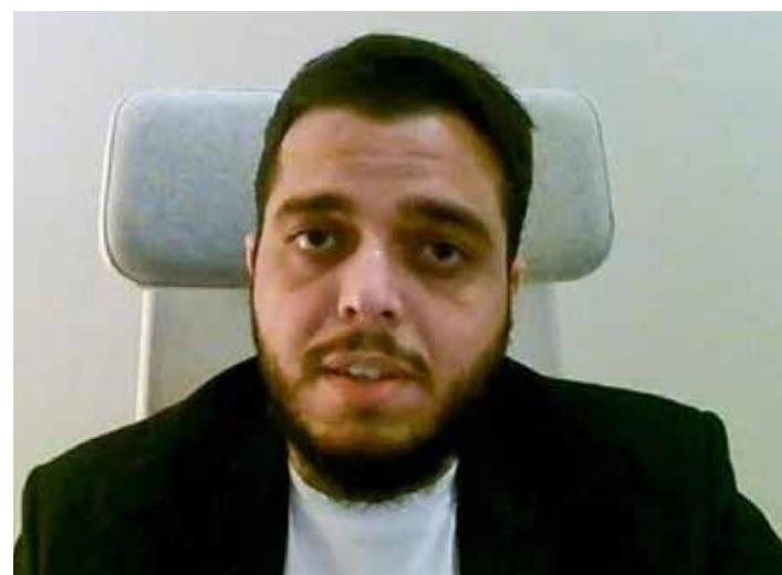
FIFA-tjänstemannen Abdullah Ibhaïs dömdes i december år 2021 till tre års fängelse. N.u kan han åtalas igen vilket kan leda till ett ytterligare fängelsestraff.