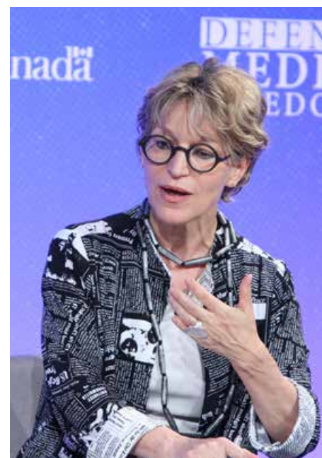
Agnès Callamard, generalsekreterare.

Som exempel förnekas palestinska medborgare i Israel sin nationalitet och skiljs